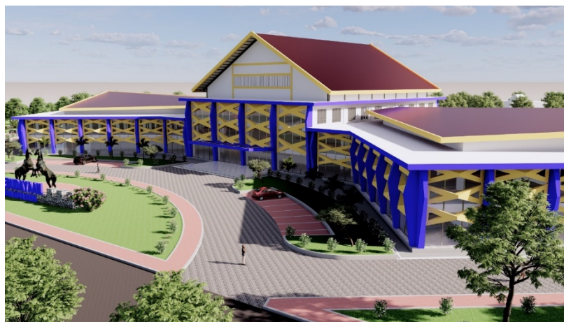
Gambar 6. Tampilan Bangunan

Perancangan fasilitas ini pula di telah di analisa dengan beberapa komponen analisa yang digunakan seperti Analisa tapak dan zonasi, Analisa aturan guna lahan dan tata bangunan, Analisa kontur, Analisa vegetasi dan lapisan penutup lahan, Analisa fitur buatan manusia on site dan off site, Analisa sirkulasi kendaraan dan sirkulasi pendesterian, Analisa utilias, Analisa view on site dan off site, Analisa kebisingan, Analisa polusi udara, Analisa point of intrest, Analisa manusia dan budaya, serta Analisa Analisa iklim seperti lintasan matahari, arah angin dan curah hujan. Sehingga menghasilkan desain Pusat Kebudayaan Kabupaten Muna ini.