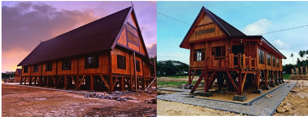
Gambar 1. Rumah Adat Suku Muna