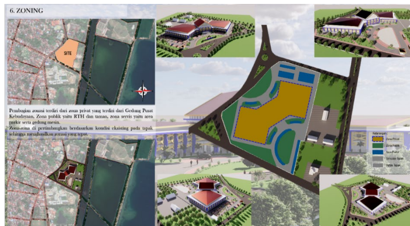
Gambar 4. Respon Desain Zoning

Daya tampung dan rutinitas ruang pada Pusat Kebudayaan disesuaikan terhadap kebutuhan yang terdiri dari kegiatan utama seperti ruang pementasan, pameran budaya/museum dan workshop, ruang kegiatan penunjang seperti, kantor, ruang ganti, ruang latihan, ruang control, ruang ibadah dan ruang servis, serta ruang kegiatan pendukung seperti lobby, cafetarian, ruang terbuka, area parkir, dan sebagainya.