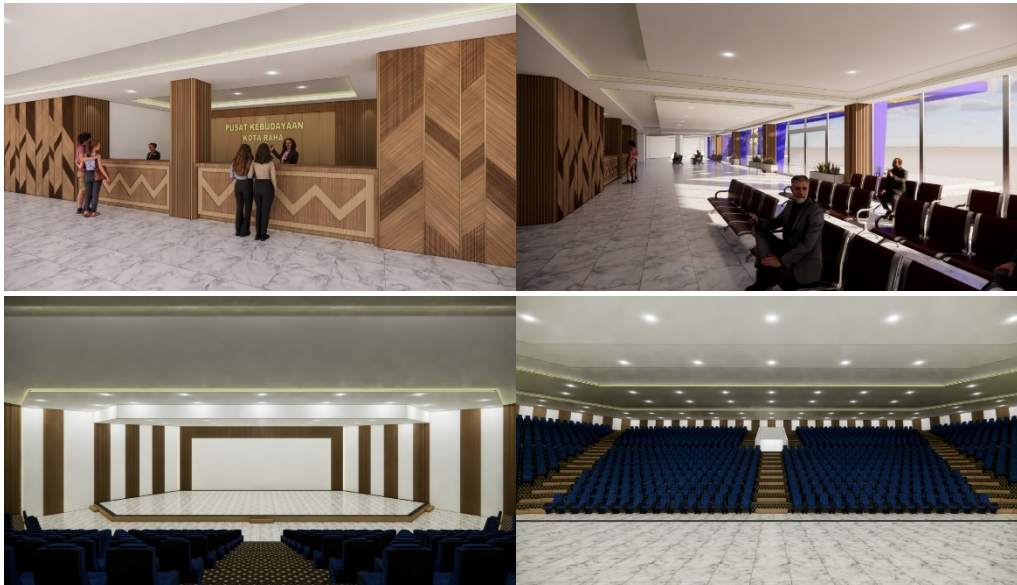
Gambar 10. Interior Pusat Kebudayaan Kabupaten Muna

macam gaya. Ciri konsep kontemporer yaitu memanfaatkan material yang natural, memiliki warna yang bernuansa netral, penggunaan pencahayaan yang alami.