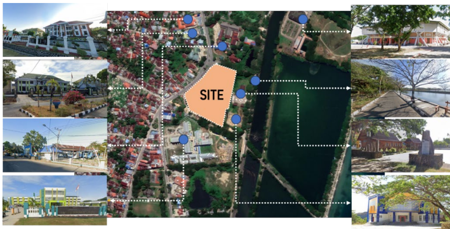
Gambar 2. Site Lokasi Pusat Kebudayaan Kabupaten Muna

Lokasi perancangan Pusat Kebudayaan Di Kabupaten Muna Berada di jalan M.H. Thamrin, Kecamatan Katobu, Kabupaten Muna, Sulawesi Tenggara. Akses menuju lokasi ini terbilang baik dengan jalanan beraspal. Diapit secara langsung oleh empat jalan yang terhubung, sekomples dengan Museum Bharugano Wuna dan Perpustakaan Daerah Kabupaten Muna. Selain itu memiliki jarak tempuh sekitar 270 meter dari Rumah Sakit Dearah (RSUD) Kabupaten Muna. Jarak tempuh sekitar 1.619 meter dari Pelabuhan kabupaten Raha. Jarak tempuh 870 meter dari Sarana Olahraga (SOR) La Ode Pandu. Jarak tempuh 950 meter dari Masjid Agung Al Munajad. Jarak tempuh 220 meter dari Perkantoran. Jarak tempuh 600 meter dari Alun-alun Raha.