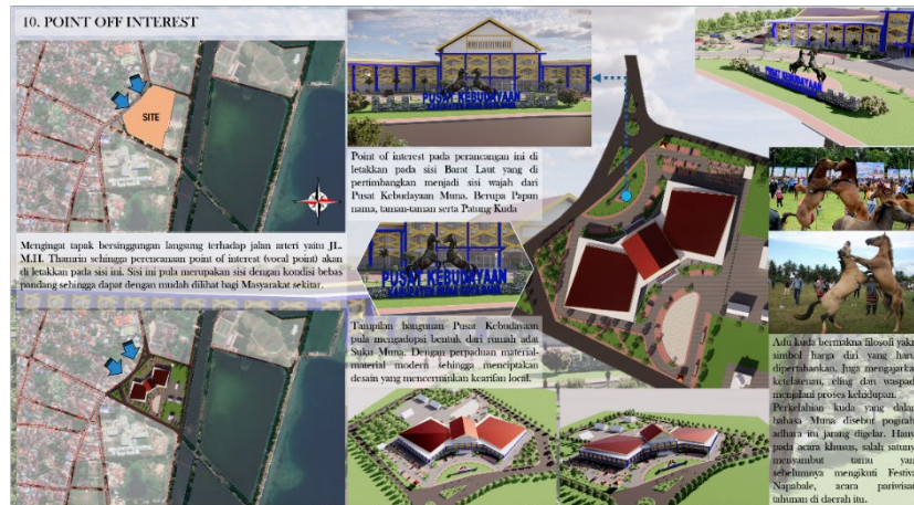
Gambar 7. Tampilan Bangunan

Point of interest pada perancangan ini di letakkan pada sisi Barat Laut yaitu pada Jl. M.H. Thamrin yang di pertimbangan menjadi sisi wajah dari Pusat Kebudayaan Muna. Berupa Papan nama, taman-taman serta Patung Kuda. Adu kuda mempunyai makna filosofis, khususnya gambaran harga diri yang harus dijaga. Terlebih lagi mengajarkan kesabaran, kesediaan dan kesediaan dalam menjalani jalan hidup. Adu kuda yang dalam dialek Muna disebut pogiraha adhara sesekali digelar. Adapun pada acara-acara khusus, salah satunya mengundang pengunjung yang sebelumnya mengikuti Perayaan Napabale, sebuah acara pariwisata tahunan di wilayah tersebut.