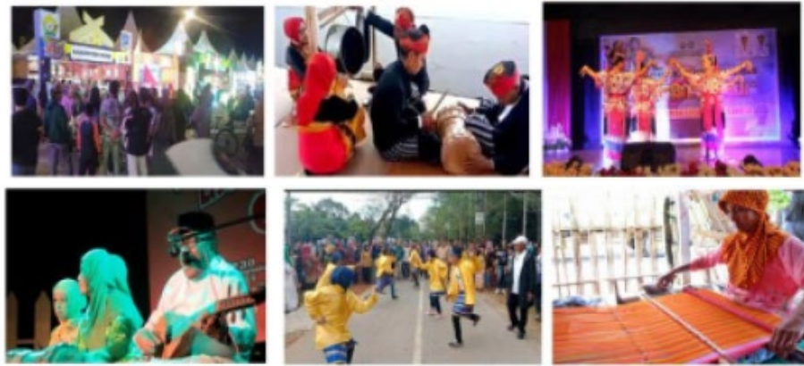
Gambar 3. Beragam Tradisi dan Kebudayaan Suku Muna Sumber :Penulis

Daya tampung dan rutinitas ruang pada Pusat Kebudayaan disesuaikan terhadap kebutuhan yang terdiri dari kegiatan utama seperti ruang pementasan, pameran budaya/museum dan workshop, ruang kegiatan penunjang seperti, kantor, ruang ganti, ruang latihan, ruang control, ruang ibadah dan ruang servis, serta ruang kegiatan pendukung seperti lobby, cafetarian, ruang terbuka, area parkir, dan sebagainya.