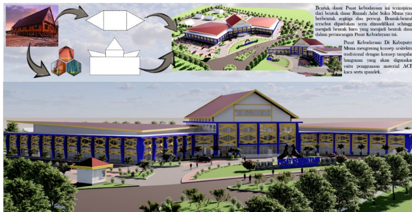
Gambar 5. Konsep Gubahan Massa

ini. Konsep tampilan bangunan yang akan di gunakan yaitu penggunaan material ACP, spandek serta kaca.