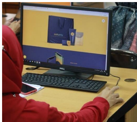
Gambar 1. Praktek Brand oleh Peserta

Pada sesi selanjutnya, setelah brand identity terbentuk, peserta pelatihan kemudian membuat visual identity, yaitu elemen visual merek seperti logo, warna, tipografi, dan elemen desain lainnya. Pada sesi pelatihan membuat visual identity, peserta akan belajar untuk merancang visual identity atau identitas visual dari sebuah merek.